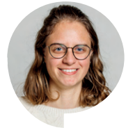
Chloé Ingénieure recherche