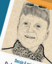
Dessin & peinture Delphine MAIGNAN