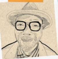
Dessin Aquarelle Yao ADEKPLOVI