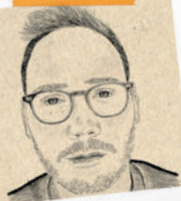
Dessin & peinture Clément DESFORGES