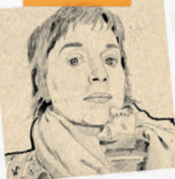
Céramique Delphine BONNET