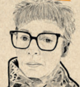
Mosaïque, La fabrique, sculpture, design & décoration Valérie FREMONT