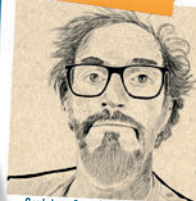
Sculpture & modelage de la terre, La fabrique dessin & peinture Lucio DE ARAUJO